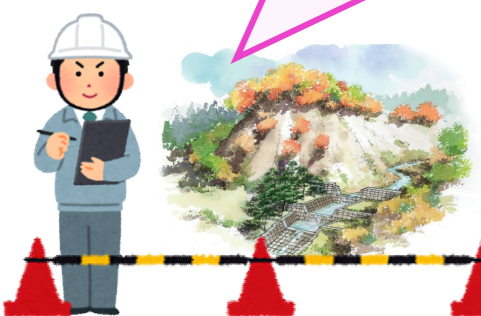
升形トンネル戸沢村側に完成イメージ看板