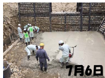
均しコンクリート打設状況