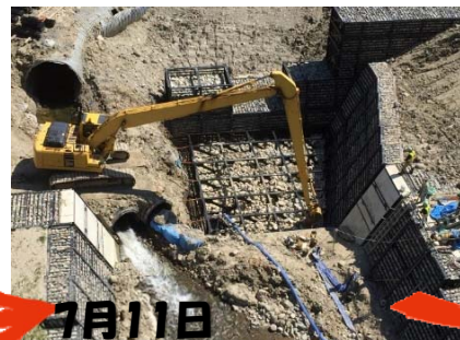
鋼製枠中詰め作業状況